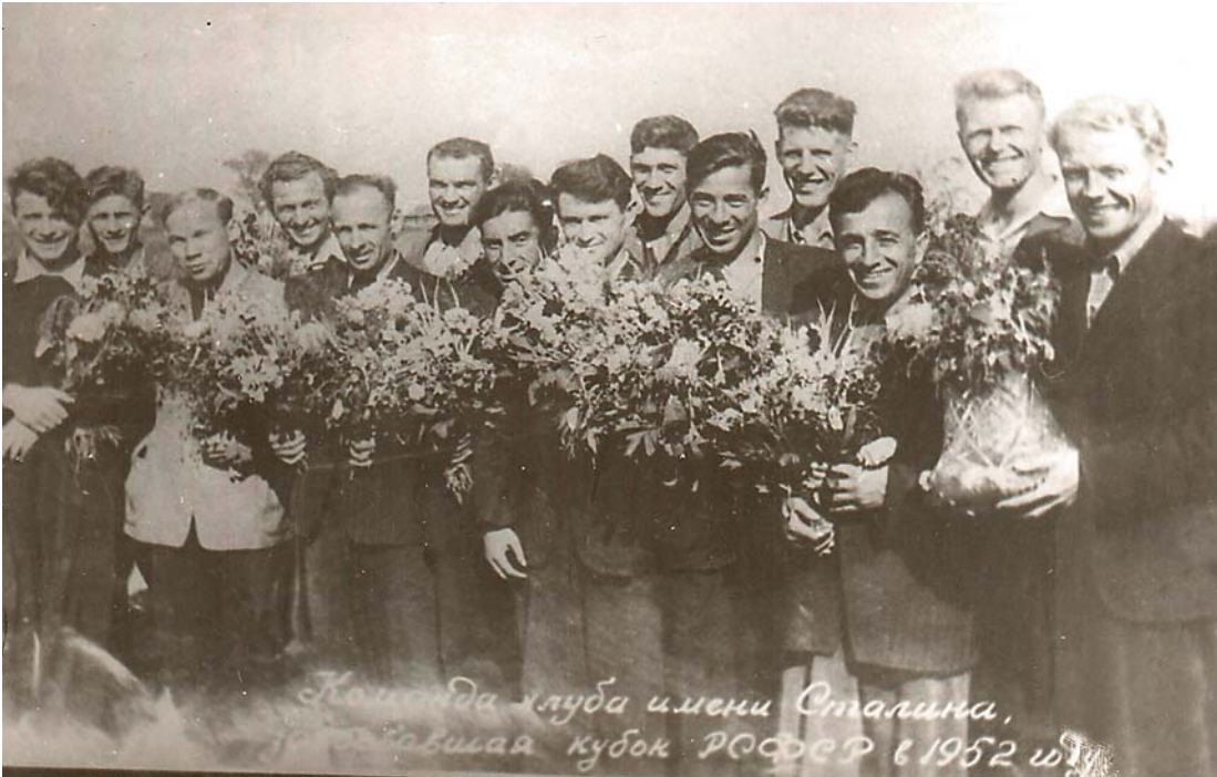
Команда СК им. Сталина — обладатель Кубка РСФСР, 1952

1952 год. В борьбу за Кубок РСФСР включились около 9 тысяч команд. Среди них и наша молотовская команда спортивного клуба имени Сталина, представляющая моторостроительный завод. На предварительном этапе были повержены березниковский «Химик» — 4:2, нижнетагильский «Дзержинец» — 6:1. Затем еще один представитель Нижнего-Тагила «Металлург» — 5:0, динамовцы Омска — 1:0 и «Дзержинец» из Челябинска — 6:2. В четвертьфинале наши футболисты обыграли команду Горького — 2:0.