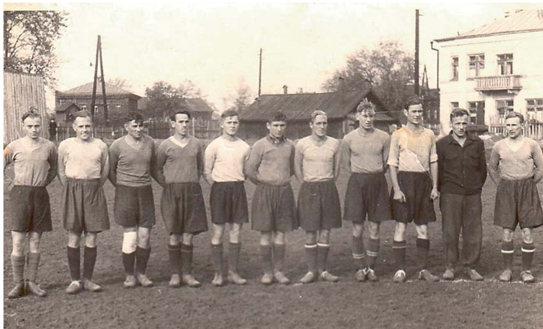
Команда «Энергия» (Молотов), 1952

Сильнейшей командой в чемпионате Молотовской области стала «Красная Звезда» из Краснокамска. Футболисты «Красной Звезды» со счетом 4:2 обыграли «Мотор» из Кизела в финале кубка области.